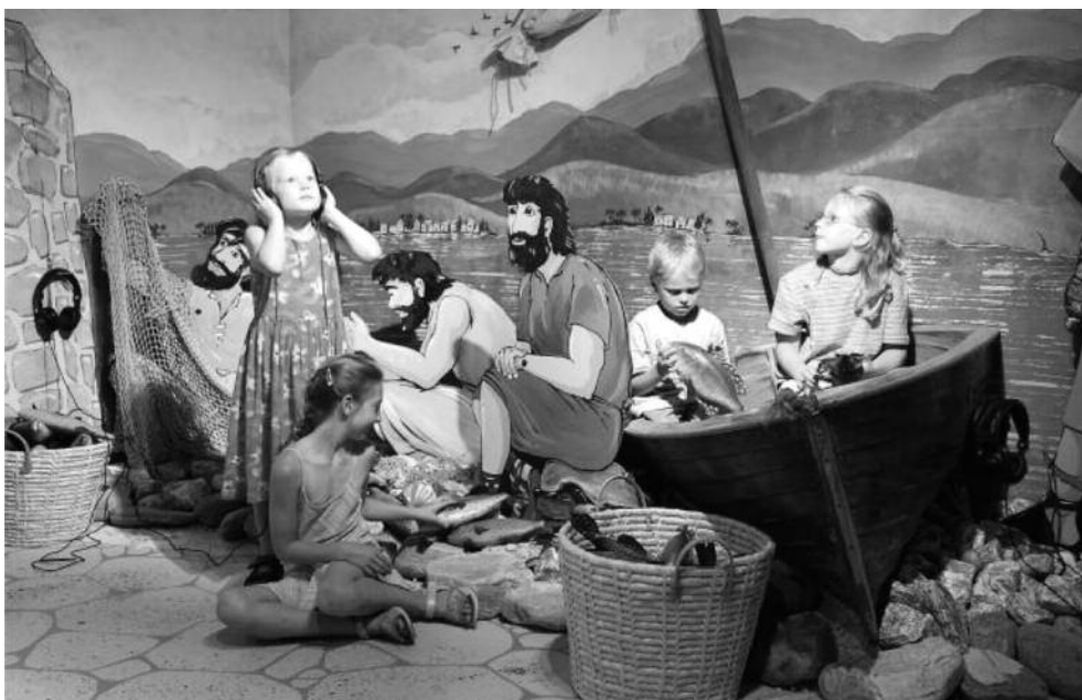
Eine Kulisse mit See, Fischern und einem richtigen Fischerboot, in das sich Kinder setzen können, führt in die Heimat Jesu und zum Ort, wo er die ersten Jünger berief.

Zudem bemängelt Stüfen, dass die Studie die diversen Haftbedingungen nicht unterscheidet. Die Situationen in der Untersuchungshaft, im Strafvollzug und im Ausschaffungsgefängnis seien grundlegend verschieden. Dem trage die Gefängnisseelsorge jeweils Rechnung. KIPA ■