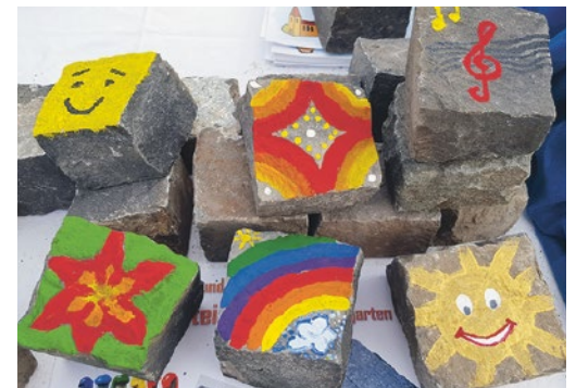
Am Stand am Städtlimarkt wurden fleissig Randsteine für den Kirchgarten bemalt.