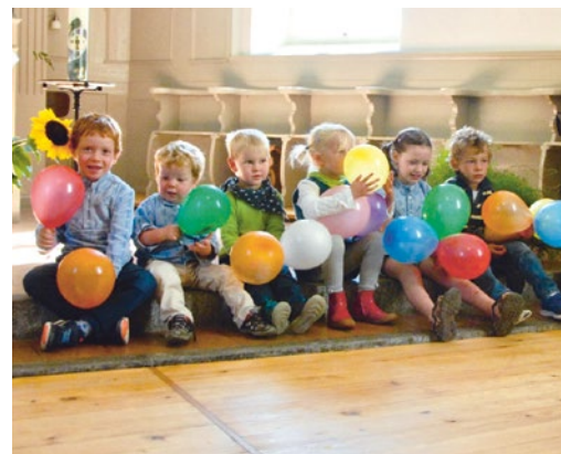
Gottesdienst am 10. August: Die Kinder mit duftenden Ballonen zum Thema «Landluft».