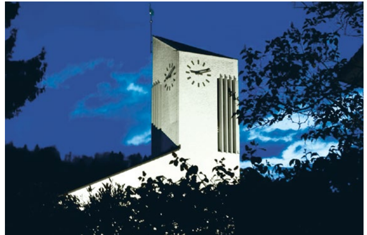
Evangelische Kirche Lichtensteig: 1967 eingeweiht.