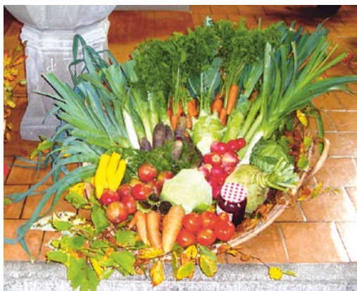
Erntedank-Gaben beim Taufstein in Krinau