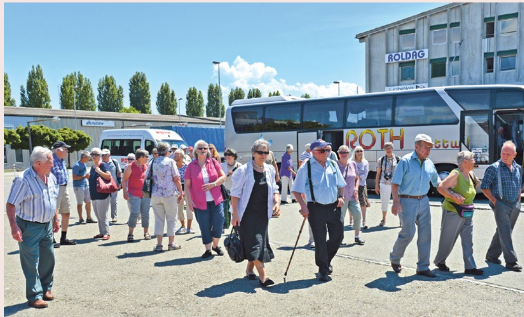
Ankunft in Rohrschach. Der Weg zum Schiff.

Rund sechzig Reisefreudige sammelten am 6. Juli Eindrücke vom Bodensee und Appenzellerland