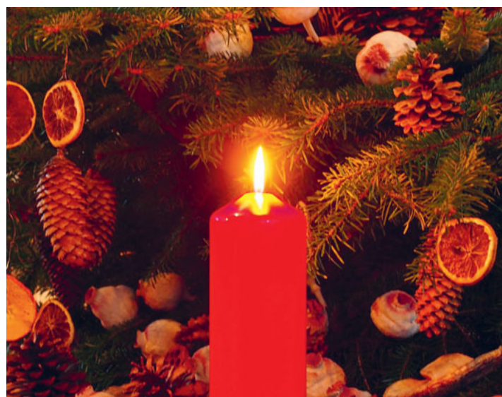
Momente, um zur Ruhe zu finden.

spruch von Gottes Versprechen: sein Licht wird kommen.