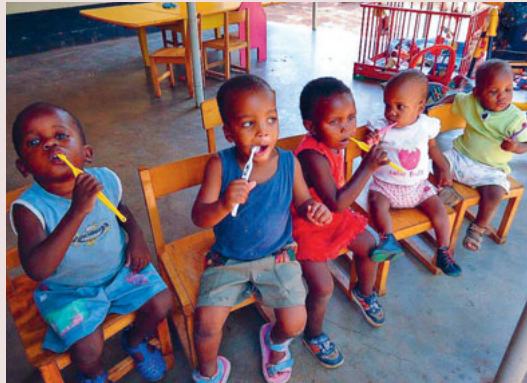
Auch Hygiene will gelernt sein.

In diesem Jahr sammelt die Kirchgemeinde Mittleres Toggenburg für eine Solaranlage eines Waisenhauses in Simbabwe