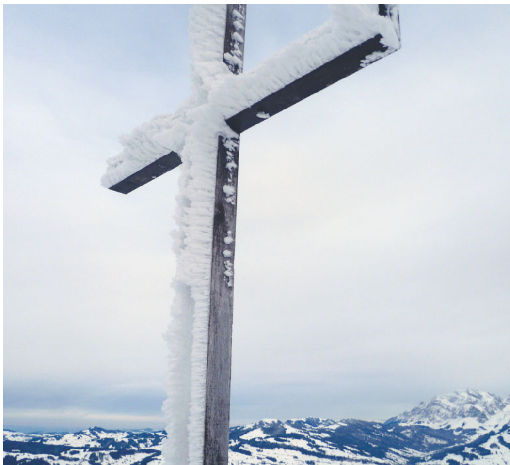
Gipfelkreuz auf dem Tanzboden