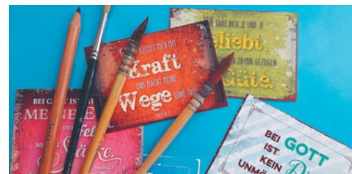
Mit Pinsel und Stift einen Spruch gestalten

Um Anmeldung an das Sekretariat wird bis 5. Februar gebeten. Ausführlichere Infos finden Sie unter www.ref-mtg.ch/angebote/ref500 Brigitte Brunner, Nanette Rüegg (AG Ref500)