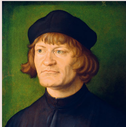
Der 32jährige Huldrych Zwingli, gemalt von Albrecht Dürer