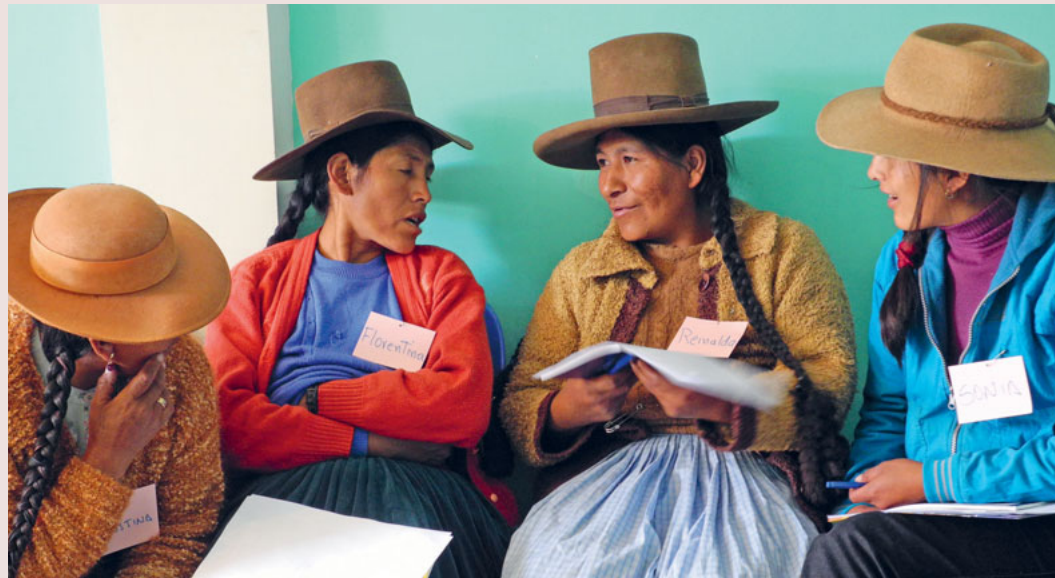
Alphabetisierungskampagne für Indiofrauen.

Das in der Passionszeit gespendete Geld kommt der Arbeit von Mission 21 in Bolivien, Chile, Peru und Costa Rica zu. Sie umfasst 20 verschiedene Projekte