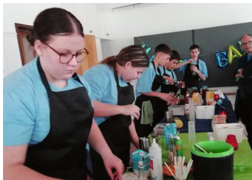
Jugendliche aus dem Erlebnisprogramm mixen Drinks.

Im Voraus viel zu diskutieren gab die Frage: Darf die zweite, momentan nicht besetzte Pfarrstelle entweder durch eine Pfarrperson oder mit einer oder mehreren Personen in Teilzeit, zum Beispiel aus dem diakonischen oder religionspädagogischen Bereich, besetzt werden? Die anschliessende Abstimmung fand geheim statt. 73 Stimmberechtigte sprachen sich für eine Öffnung der Personalsuche aus, 2 dagegen.