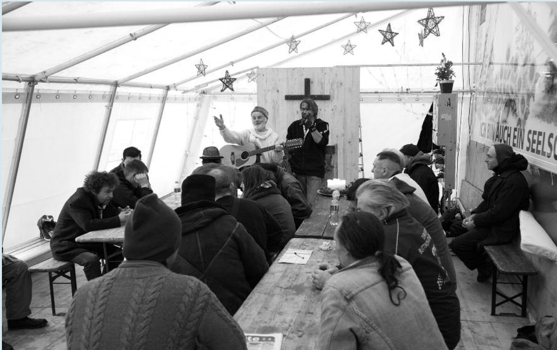
Eines der neueren Projekte der Sozialwerke Pfarrer Sieber ist der «Pfuusbus».

Sekretariat: Toggenburgerstrasse 50, 9500 Wil, Telefon 071 912 22 92, E-Mail sekretariat@ref-wil.ch, Homepage www.refwil.ch