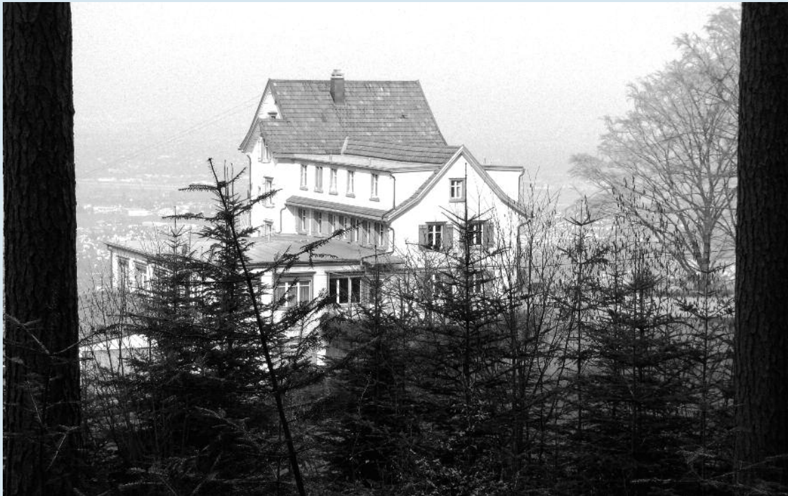
Der Sonneblick hat eine bewegende Geschichte hinter sich, die im Zeichen des Helfens steht.

Sekretariat: Toggenburgerstrasse 50, 9500 Wil, Telefon 071 912 22 92, E-Mail sekretariat@ref-wil.ch, Homepage www.refwil.ch