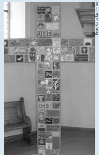
Das Keramik-Kreuz in der Kirche.

Am Donnerstagnachmittag wenn das Bistro geöffnet ist, steht auch unsere Kirche offen für Menschen, die beten wollen oder eine Zeit und einen Ort der Stille suchen. Vielleicht könnte ein Keramikplättchen unseres Kreuzes der persönlichen Andacht eine anschauliche Anregung geben?