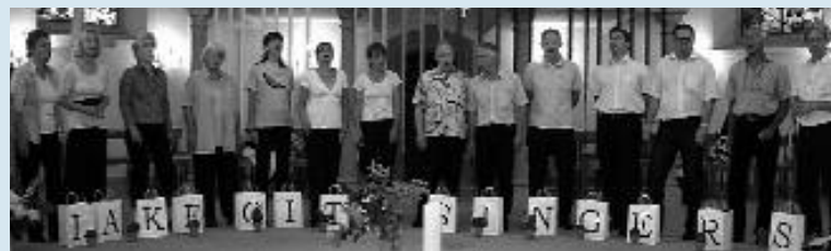
Gottesdienst mit den Lake City Singers, welche anschliessend zur sonntäglichen Matinée, ebenfalls in der Kirche, eingeladen haben.

Der nächste «Jung und Alt»- Gottesdienst findet am 12. Sep- tember statt.