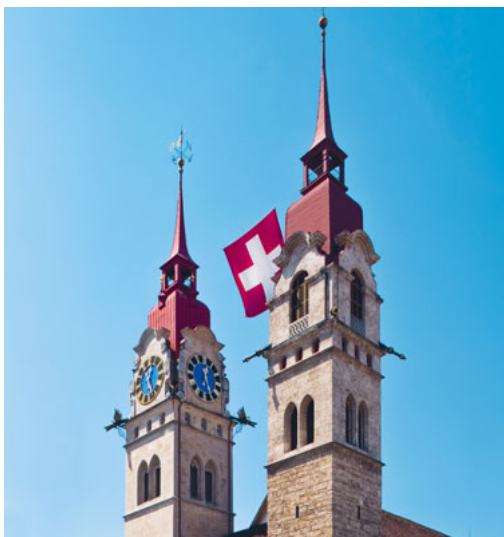
Keine Seltenheit am 1. August: Die Schweizerfahne aussen an der Kirche ...

Kennen Sie eigentlich unsere Nationalhymne? Wann haben Sie sie das letzte Mal gesungen? Sie steht in unserem Gesangbuch unter der Nummer 519, heisst «Schweizerpsalm» und kann gleichermassen als Anrufung Gottes wie als Bekenntnis verstanden werden.