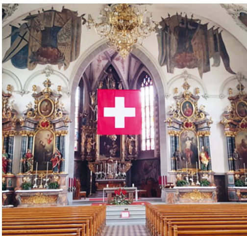
... und innen.

Auch wenn sie wie das «Lied der Deutschen» im Jahr 1841 gedichtet wurde und daher unverkennbar die Züge ihrer Zeit trägt, so ist dem Bundesrat zuzustimmen, wenn er vor wenigen Jahren erklärte, «die heutige Landeshymne brauche den Vergleich mit zeitgenössischen Schöpfungen nicht zu scheuen und sei dank ihrer Bekanntheit eine würdige Landeshymne.» So erübrigen sich weitere Diskussionen um ihre sprachliche Gestalt und ihre vermeintlich unzeitgemässen Aussagen. Es erübrigen sich alle weiteren Versuche, sie durch eine neue Hymne ersetzen zu wollen.