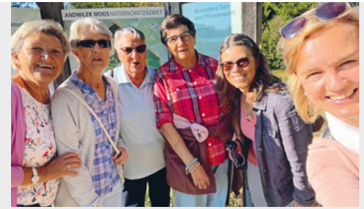
Teilnehmende Wiesental-Treff im August.

9.30–16.30 Uhr, Annette freut sich auf Ihren Besuch