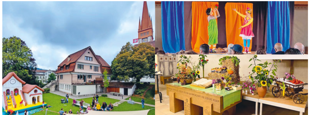
Text: Alain Girardet

Mit Kopf, Herz und Hand war die Evangelisch-Reformierte Kirchgemeinde an diesem Wochenende für hunderte Menschen sichtbar und erlebbar.