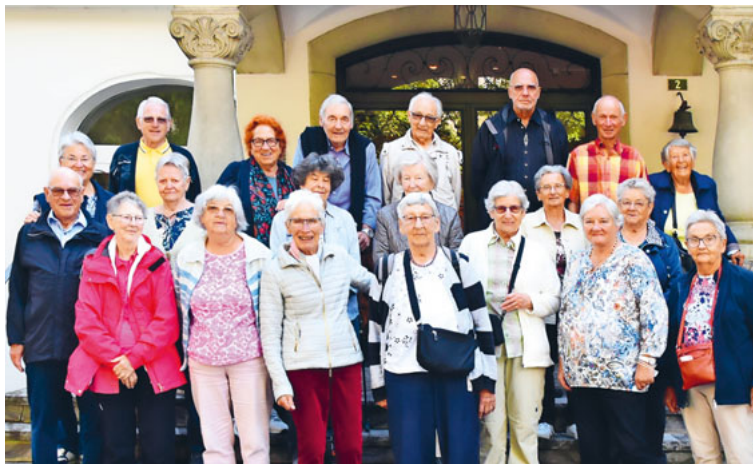
Die gutgelaunten Seniorinnen und Senioren des Mittleren Toggenburgs reisten dieses Jahr ins Berner Oberland.