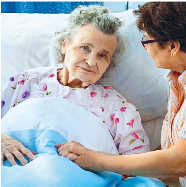
Angehörige in der letzten Lebensphase begleiten, birgt viele emotionale Unsicherheiten.

Ein Aufbaukurs ist geplant in Wattwil am 7. und 21. Mai 2022. Der Besuch des Grundkurses ist Bedingung für die Teilnahme am Aufbaukurs.