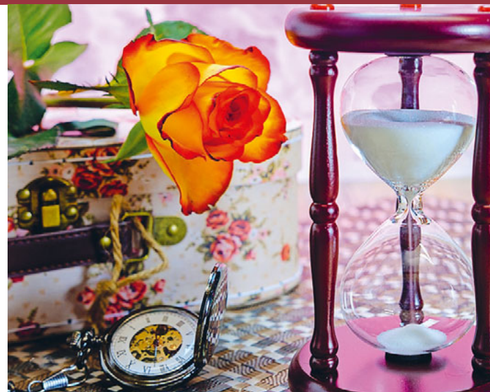
Im KidsCamp hüpfen die Kinder von einer Epoche zur andern - mithilfe einer Zeitmaschine.

21. Oktober, Kirche Krinau 18. November, Kirche Lichtensteig 16. Dezember, Kirche Lichtensteig