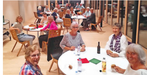
Höck Kantorei September 2021