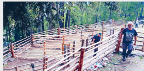
Erneuerung «Gatter für Schafe».