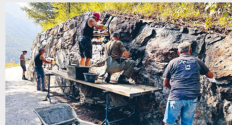
Ein Teil der Mauersanierung.