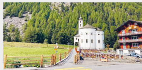
Zaunerneuerung Kirchweg Saas Balen.

Vom 20. bis 26. August waren, wie letztes Jahr schon, die Bergversetzer in Saas-Balen im Einsatz. Es konnte wieder einiges erschafft werden. Herzlichen Dank allen Beteiligten für die wertvolle Arbeit. Für weitere Impressionen besuchen Sie bitte unsere Website.