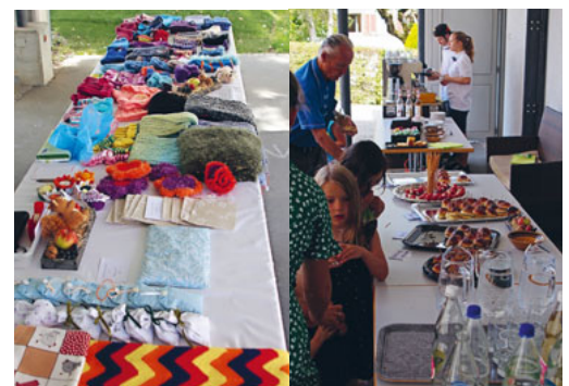
Handarbeiten der Strickgruppe welche zum Verkauf angeboten wurden und zum Abschluss ein feiner Apéro.