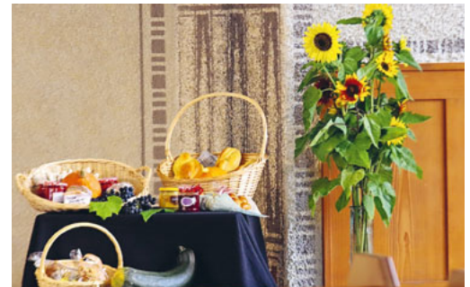
Erntedankgaben dessen Erlös zugute der Kollekte kam.