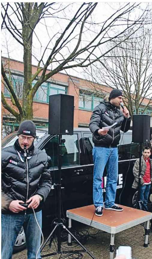
Kirche und Politik - Sollen Kirchen als Organisation oder Ihre Vertreter:innen sich politisch äussern?

In der Schweiz ist es zwar in jedem Kanton ein bisschen anders, aber immer so, dass dem Staat zumindest eine gewisse Aufsicht zusteht. Und es ist nicht verboten, dass Glaubende und ihre Gemeinschaften sich in politischen Dingen bemerkbar machen und mitmischen.