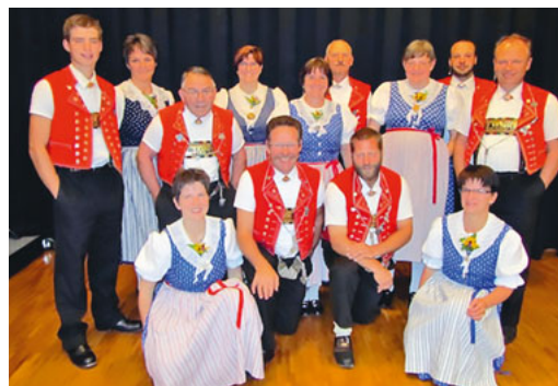
Der Jodelclub Alperösli Wattwil singt am Chilbi-Gottesdienst.