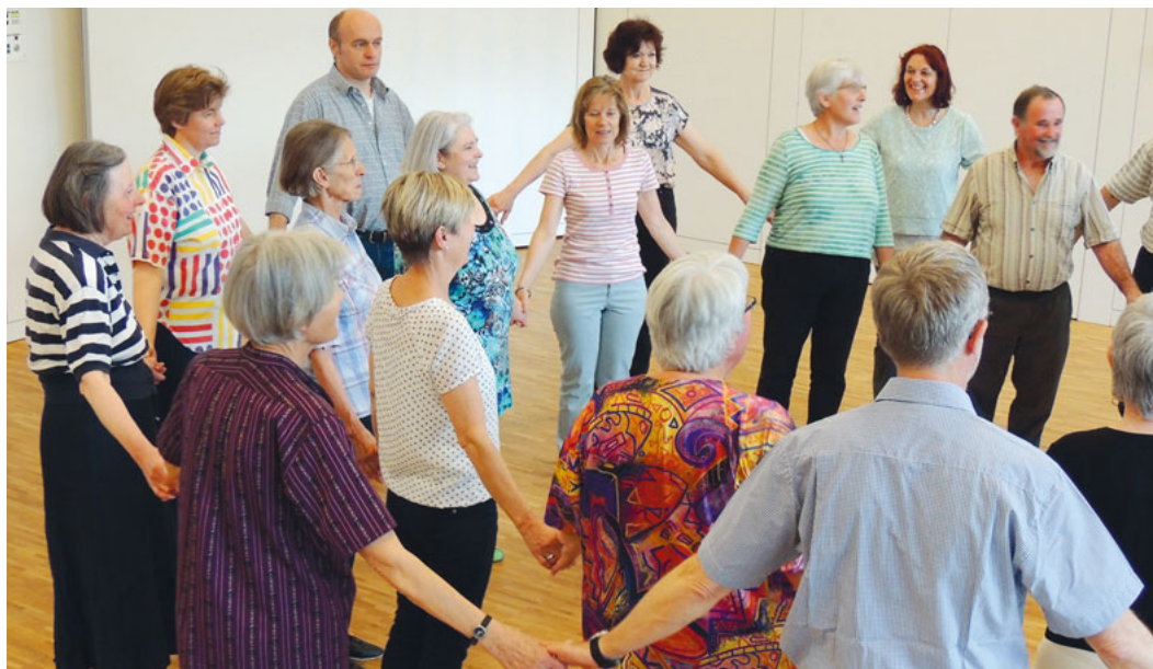
Beim Kreistansen machen Frauen und Männer freudig mit.

RH: Wir treffen uns immer am letzten Freitag im Monat in der Kreuzkirche ab 19.30 Uhr, das nächste Mal am 25. August. ■