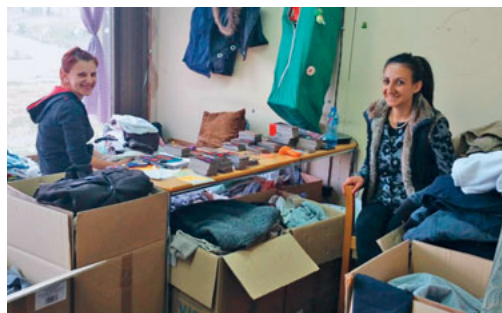
Arbeitsstellen werden geschaffen – Mitarbeiterinnen am Kleider sortieren.