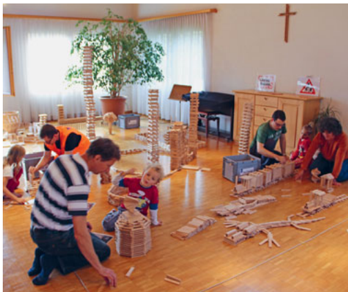
Gross und Klein hatten sehr viel Spass, gemeinsam architektonische Kunstwerke zu bauen.

Mit diesen Worten lässt sich das Wochenende mit der Holzbauwelt in Salez umschreiben. Kinder mit ihren Eltern waren auf die Baustelle der Holzbauwelt für den Freitagabend und den Samstag eingeladen. Die Holzbauwelt ist ein Projekt des Bibellesebundes. Nebst dem Singen und den Geschichten stehen die 80'000 Parketthölzlein im Zentrum. Der Fantasie setzt nur die Schwerkraft ihre Grenzen. Ziel war es, sich mal ganz bewusst mit seinen Kindern Zeit zu nehmen, um einfach ohne Ablenkung mit seinen Kindern zu bauen und zu spielen. Zum Abschluss fand ein Familiengottesdienst zum Thema: «Bau dein Haus nicht auf Sand». Danach konnten alle beim anschliessenden Apéro die Bauwerke bewundern. Text und Foto: Ruedi Eggenberger