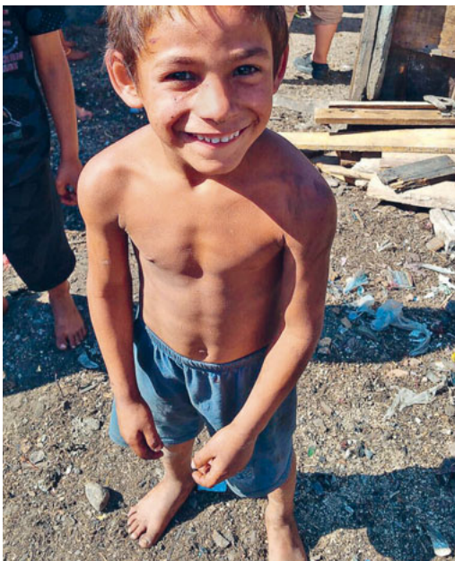
Romabub im Ghetto

Eindrücklich bleibt uns unser Besuch im Ghetto von Sliven. In der ummauerten Stadt auf der Fläche von vielleicht 800x600 Metern hausen 25.000 Menschen. Die erste Häuserreihe lässt noch nichts von der Not der Menschen erahnen. Alle 100 Meter tiefer im Slum drin verändert sich aber die Szenerie zum Schlechten. Wir besuchten eine Familie im hintersten Teil des Ghettos. Sie leben in einem Raum von vielleicht 5x5 Metern, ein Türloch, ein Fensterloch, das sie gerne noch vor dem ersten Schnee mit einer Tür und einem Fenster versehen würden.