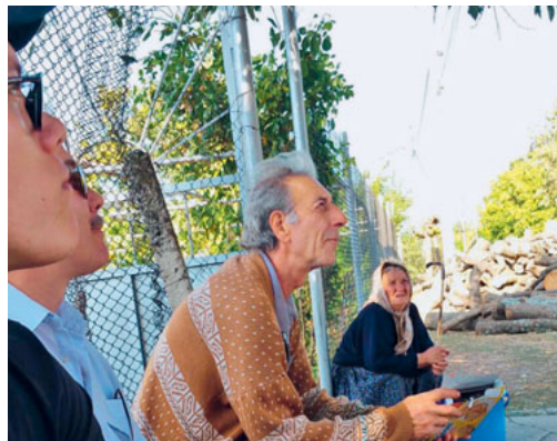
Gastfreundliche Dorfbewohner schwatzen mit Fremden