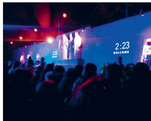
Countdown vor dem Eröffnungsspektakel am Reformationsdenkmal in Genf

Mit 4700 Jugendlichen aus der ganzen Schweiz durfte die Konfirmandengruppe das Reformationsjubiläum in Genf miterleben. Mit viel Licht, Action, Workshops, Konzerten, Musik, Predigten, uvm. war es ein sehr buntes und fröhliches Spektakel mit Tiefgang. «Be a Reformer» – «Sei einer, der Veränderungen mitgestaltet» war der klare Aufruf, den wir mit nach Hause genommen haben.