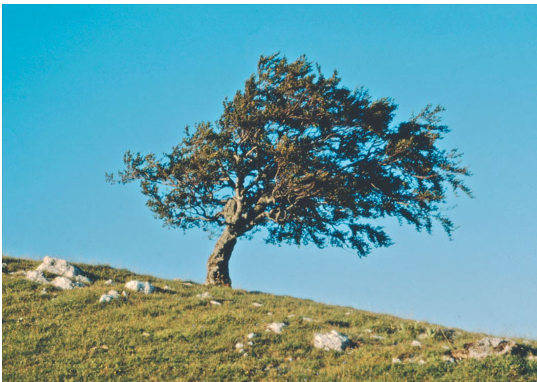
War der Wind vor 500 Jahren ein lebensbedrohlicher Sturm?

Vieles hat sich seither verändert. Was bleibt, ist die Herausforderung, die innere Schönheit des Evangeliums zu betrachten und dabei das Gewitter nicht zu fürchten. Als einzelner wie als Kirche. ■