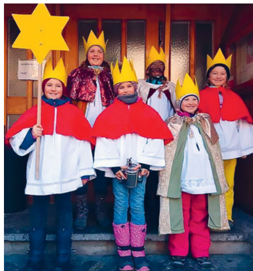
Sternsinger in Stein

Schneit es gerade oder taut es schon wieder? Bläst es uns Dächer von Häusern, werden Bäume entwurzelt oder flattern uns nur die Ohren? Das Wetter ist und wir handeln entsprechend oder wettern manchmal mit. Zumindest zeitigen wir die Folgen. Das ist simple Erfahrung.