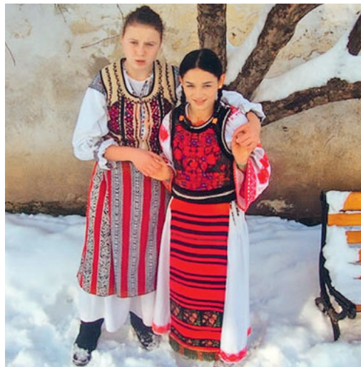
Kinder in Rumänien

Die Sternsinger sammelten in diesem Jahr für den Verein «Pentru copii abandonati», welcher in Rumänien private Kinderheime aufbaut. Verlassene Kinder finden dort in einem familiären Umfeld ein neues Zuhause, Geborgenheit und liebevolle Betreuung. Mit Spenden aus der Schweiz finanziert der Verein zwei Kinderheime in Ghimbav in der Nähe der Stadt Brasov.