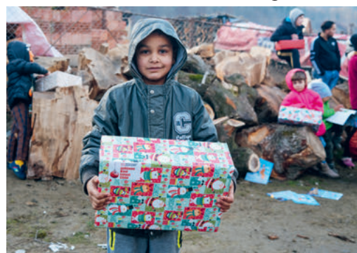
Junge aus Rumänien

Der Inhalt der Päckli für Kinder und Erwachsene ist festgelegt. Bitte packen sie ALLE und NUR die aufgelisteten Produkte in ihr Päckli. Nur so kommen diese ohne Probleme durch den Zoll und können einfach und gerecht verteilt werden. Alle nötigen Informationen finden Sie auf den Handzetteln, die ab Mitte Oktober aufliegen oder unter www.weihnachtspackli.ch . Die Päckli können im Weltladen in Grabs vom 6. bis 21. November und im zit.kafi in Gams vom 4. bis 20. November abgegeben werden. Bitte beachten Sie die Öffnungszeiten. Bei Bedarf können dort auch Schachteln in den beiden Grössen für Kinder und Erwachsene bezogen werden. Herzlichen Dank für Ihr Engagement!