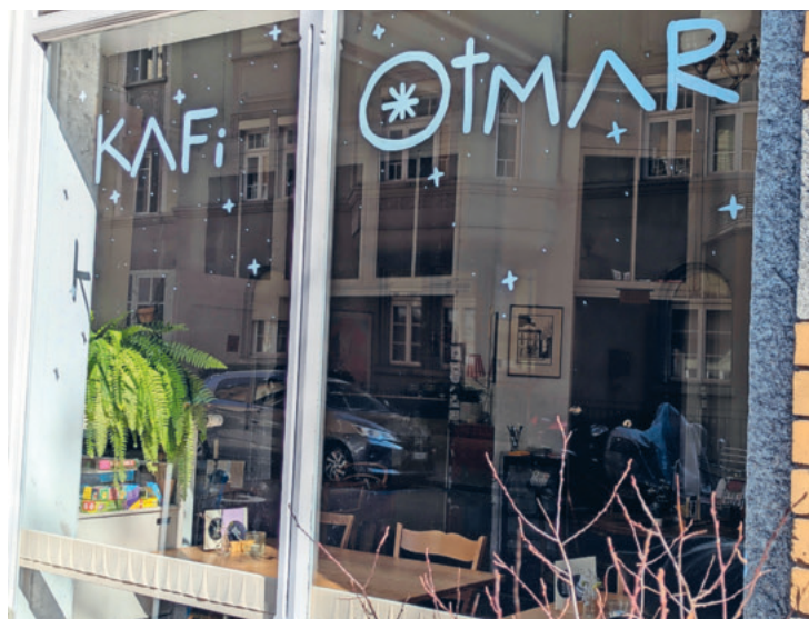
Text und Bilder: Uwe Habenicht

Manchmal gelingt es einfach nicht, mit anderen ins Gespräch zu kommen. Das Gespräch nimmt entweder schon nach den ersten Sätzen eine konfrontative Wendung oder bleibt im Banalen hängen. Diese Erfahrung machen wir täglich und spüren dabei immer wieder den Wunsch, erfüllende und gute Begegnungen zu haben. Gute Kommunikation besteht aber nicht aus cleveren Tricks, sondern entsteht aus einer bestimmten Haltung heraus, die ich im Kontakt mit anderen einnehme.