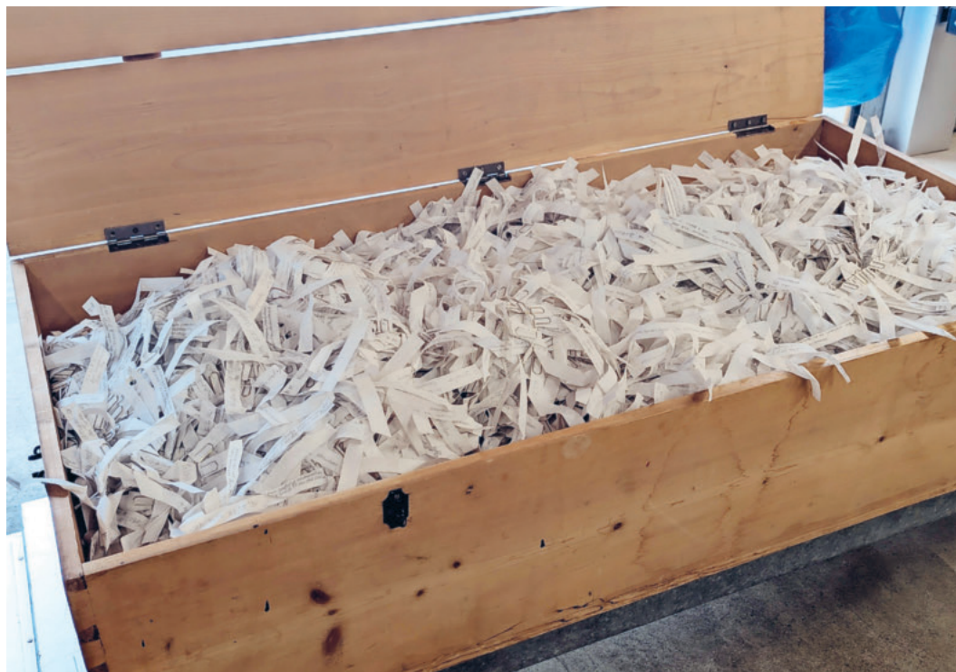
Text und Bilder: Uwe Habenicht

Seit einigen Jahren wird in St.Gallen die Aktion «Beim Namen nennen» begangen. Freiwillige schreiben die Namen, von Menschen, die auf der Flucht nach Europa ums Leben gekommen sind, auf Stoffstreifen, die rund um St.Laurenzen angebracht wurden. Parallel dazu werden 24 Stunden lang Namen in der Kirche verlesen. Inzwischen ist es nicht mehr möglich, die 50'000 beschrifteten Stoffstreifen an der Kirche anzubringen, weshalb nun auf dem Friedhof Feldli in St.Gallen ein Ort des Erinnerns geschaffen wird, an dem die eingeäscherten Stoffstreifen einen letzten Ruheort finden.