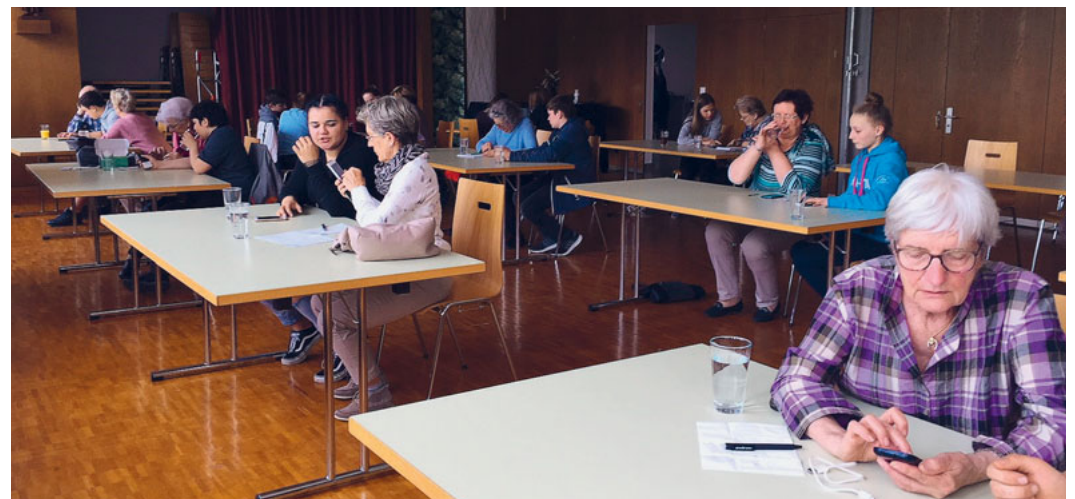
Generationen: Konfirmandinnen und Konfirmanden erklären den Seniorinnen und Senioren das Handy

Der im katholischen Pfarreiheim Heerbrugg angebotene Handykurs für Senioren war auch in diesem Jahr wieder gut besucht. Ein Dutzend Konfirmanden und Schüler der 2. Oberstufe gaben 15 Seniorinnen und Senioren (2 Ehepaare) auf deren Fragen im Umgang mit ihrem Handy Auskunft. Sie erklärten und zeigten ihnen Schritt für Schritt, wie sie vorzugehen haben. Die Seniorinnen und Senioren waren voll des Lobes. Zum Abschluss gab es ein feines Zvieri. Ein Kurs, der jedes Jahr sehr gerne und gut besucht wird.