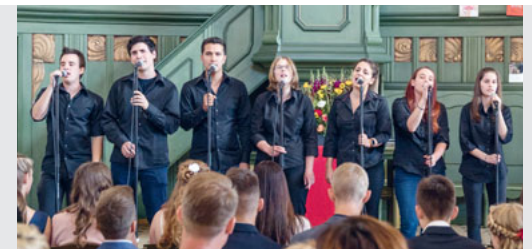
PopChor bei der Konfirmation 2017

Von Mi bis Fr gibt es Tagesmenüs, welche auf der Homepage www.sbistro.ch nachgeschaut werden können.