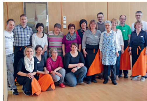
Helferteam am Suppengrossanlass