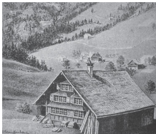
Dreischlatt in einer Darstellung von 1889