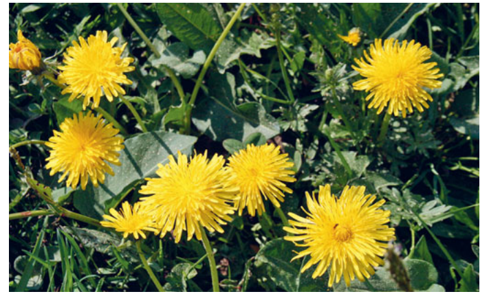
«Seht den Löwenzahn auf dem Felde»: Eine Toggenburger Version der Bergpredigt.