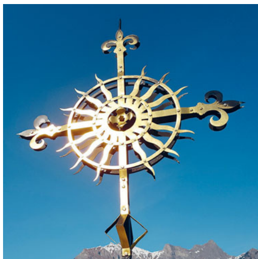
Turmkreuz der evangelischen Kirche Bad Ragaz

In der christliche Ikonographie (Bildsprache) wird Jesus Christus als Sonne vorgestellt. Er ist das alles überstrahlende Licht, das in der Dunkscheint scheint (Joh 8,12; vgl. Joh 1, 4f). In Anlehnung daran reden die Lieder unseres Gesangbuches von Christus als der Freuden-sonne und Christus als der Gnadensonne.