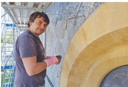
Steinmetzarbeiten: Reinigung des kompletten Sandsteinmauerwerkes; Ausräumen von losem Fugenmaterial und Neuverfugung mit Steinerfüllungsmörtel; beschädigte Steine flicken.

Spengler- und Schlosserarbeiten: Ergänzung/Ersetzung von Blechen am Turm; Schutzverglasung für kleine Fenster; Dichtungen für grosse Fenster; Instandstellung des Blitzschutzes; Geländer für Emporenbrüstung; Reparatur und Neuvergoldung der Turmbekrönung und Wimperge.