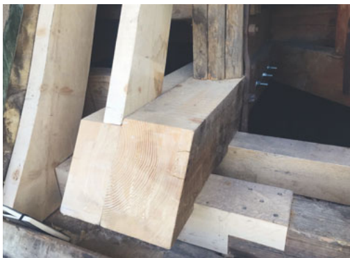
Zimmermannsarbeiten: Ersetzung des schadhafte und faulen Balkenwerkes im Turmdachstuhl.