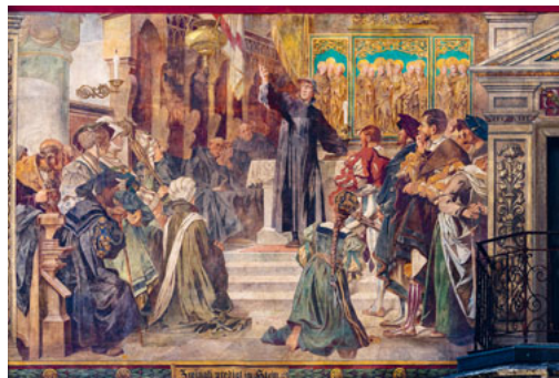
«Zwingli predigt in Stein»

Im bequemen Reisesaar sind noch einige Plätze frei. Schnell Entschlossene können sich daher telefonisch anmelden und mitreisen, auch wenn sie die Chormitglieder und deren mitreisende Gäste (noch) nicht kennen.