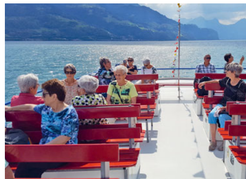
Die Senioren geniessen ihren Ausflug auf dem Walensee.