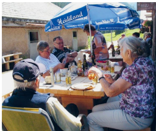
Impressionen von der Juni-Fahrt ins Blaue: Alp Kohlschlag ob Mels