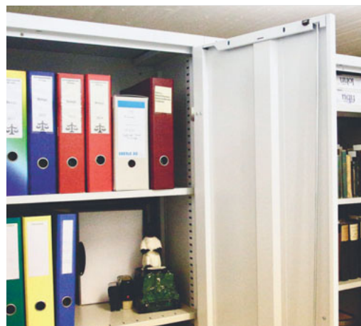
Das Krinauer Archiv am neuen Ort in Lichtensteig.