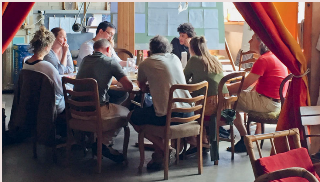
Die ökumenische Erwachsenenbildung bei einem Treffen: Eine gesellige Diskussions-Atmosphäre.

Am Samstag, 22. September, von 10 bis 14 Uhr, lädt die ökumenische Erwachsenenbildung und die mini.wirkstadt zur «Un-Konferenz» in Lichtensteig ein. Seien Sie dabei.