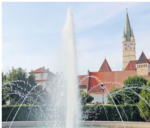
Springbrunnen in Mediasch

Doch es ist nicht Geldgier, welche das Wasser heute so kostbar macht. Es ist die Überbeanspruchung der Quellen und der grosse Wasserverbrauch durch die Industrie.