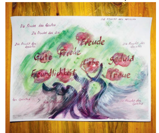
Früchte des Glaubens - gestaltet von Brigitte Brunner am Kreativ Workshop «Sola scriptura».

handlungsleitend sein soll. Der Abendmahlsgottesdienst wird vom Kirchenchor unter der Leitung von Heidi Bollhalder mitgestaltet. Sie singen Auszüge aus der Kantate «Alles was ihr tut» von Dietrich Buxtehude. Zusätzlich bereichert ein Instrumental-Ensemble bestehend aus Streicher und Orgel, den Gottesdienst. Nach dem Gottesdienst werden Apéro und Kirchenkaffee angeboten.