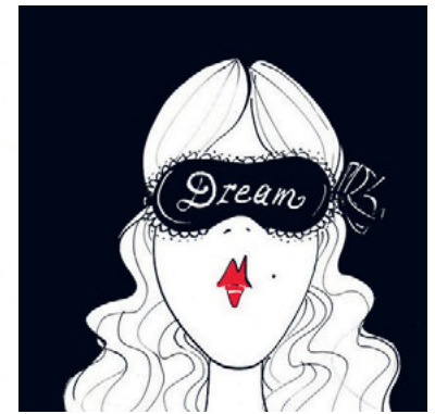
Schwarz-weiss-Denken ist in der Gesellschaft allgegenwärtig.