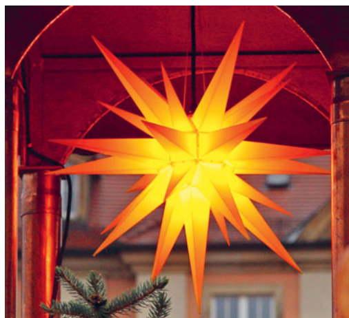
«Da sie den Stern sahen...»