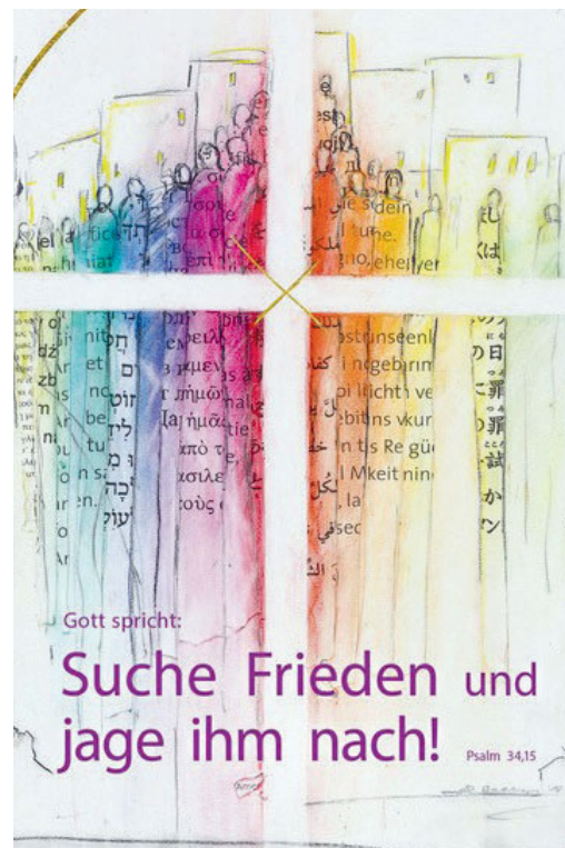
Motiv von Stefanie Bahlinger, Verlag: www.verlagambirnbach.de