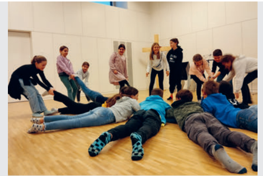
«Kinder helfen Kindern»

Die Kirchenvorsteherschaft bedankt sich bei den Kirchbürgerinnen und Kirchbürger, die an der Abstimmung teilnahmen und bei allen, die sich bereits mit einer Spende an den neuen Stühlen finanziell beteiligt haben! Möchten auch Sie eine Spende an die Stühle machen? Weitere Informationen: https://www.ref-gossau.ch/stuhlspende oder auf dem Sekretariat.