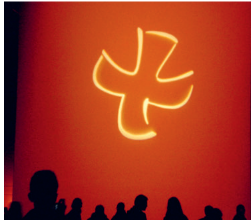
Kreuz von Taizé