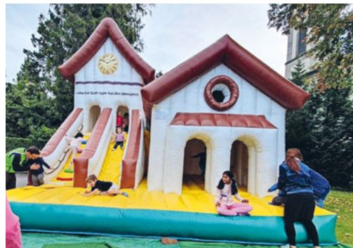
Hüpfburg slowUp 2019