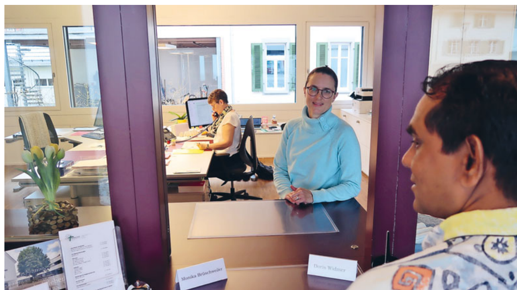
Am Schalter des Sekretariats finden vielfältige, bereichernde Begegnungen statt.

Das ist ein Ausschnitt aus den Dienstleistungen des Sekretariats. Mit diesen werden die Diakone und Pfarrpersonen von administrativen Arbeiten entlastet. Somit können sie sich vermehrt auf ihre theologische und diakonische Arbeit konzentrieren. Auch das ist Kirche! ■