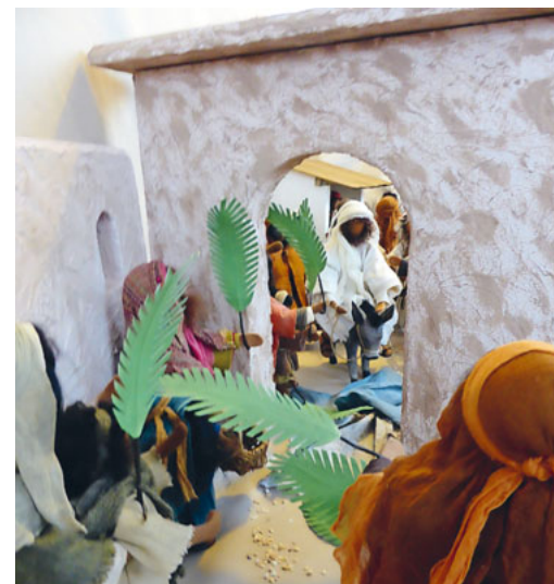
Ökumenische Osterfenster in der Altstadt

Mi, 24.4., 12.50 Uhr, Treffpunkt Bahnhof Wil