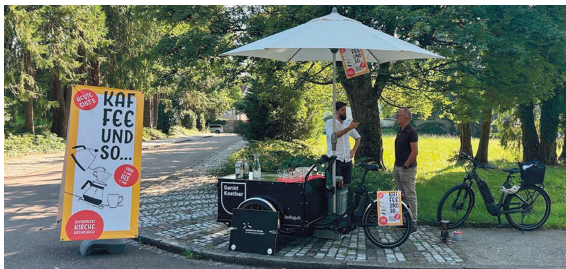
«Kaffee und so» auf dem Ostfriedhof

Das Team der Cityseelsorge von «reformiert mittendrin»