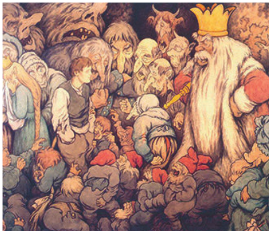
Peer Gynt