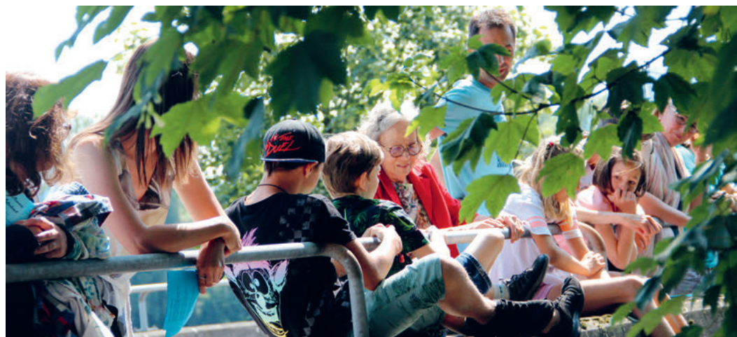
Bei der Taufe am Kanal sind alle in der ersten Reihe.