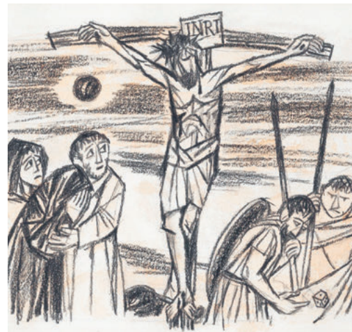
Keuzigung, Willi Trapp, 1964