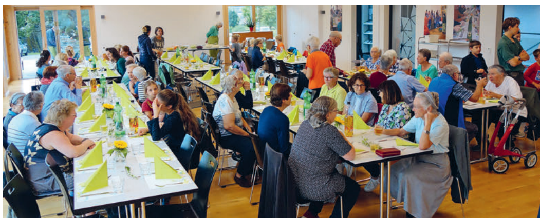
Generationenzmittag am 11. September 2024, 10-jähriges Jubiläum des Generationenhauses