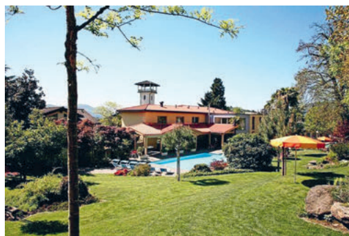
Jugendherberge Lugano Savosa

Freitag, 20. bis Sonntag, 22. Juni. Lernende der 1. und 2. Oberstufe fahren ins Oberstufenlager nach Lugano, Savosa.