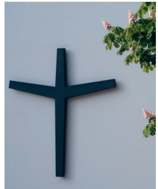
Kreuz am Eingang Kreuzkirche