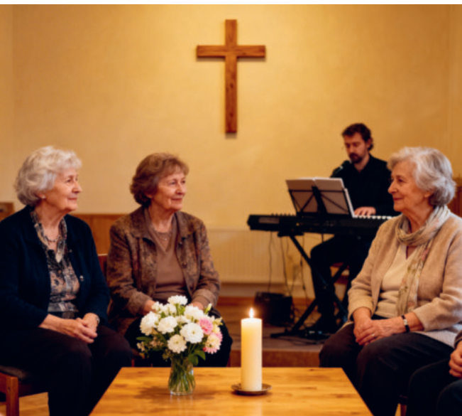
KI generiertes Symbolbild

Im Pflegezentrum Fürstenau, im Alterszentrum Sonnenhof und in den Alterssiedlungen Bergholz und Flurhof. Da kann man noch erwähnen, dass auch in Wilen und Rossrüti und in Zuzwil in den Altersheimen und im Spital Wil ähnliche Gottesdienste stattfinden, die für Personen von auswärts zugänglich sind.