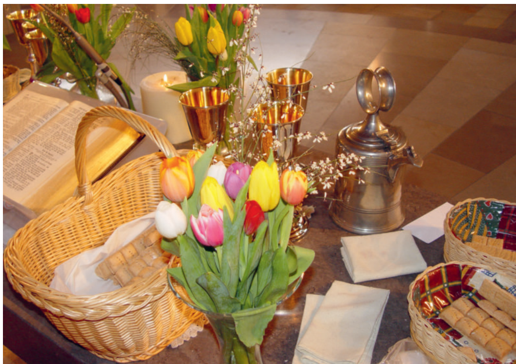
Abendmahlsfeiern an Karfreitag und an Ostern