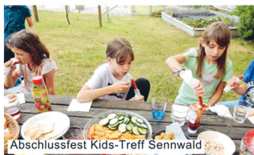
Abschlussfest Kids-Treff Sennwald