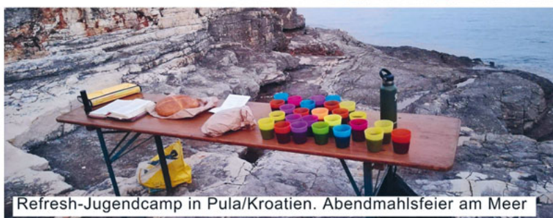
Refresh-Jugendcamp in Pula/Kroatien. Abendmahlsfeier am Meer