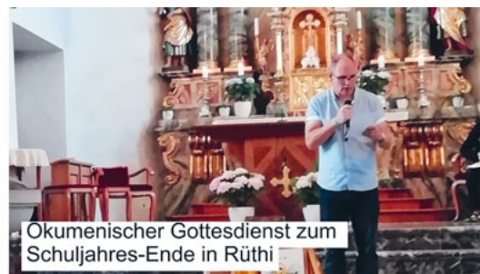
Ökumenischer Gottesdienst zum Schuljahres-Ende in Rüthi