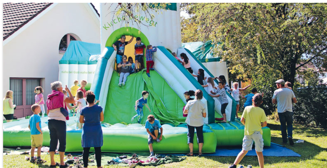
Die grosse Hüpfkirche ist ein Hit!