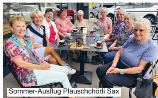
Sommer-Ausflug Plauschchörli Sax