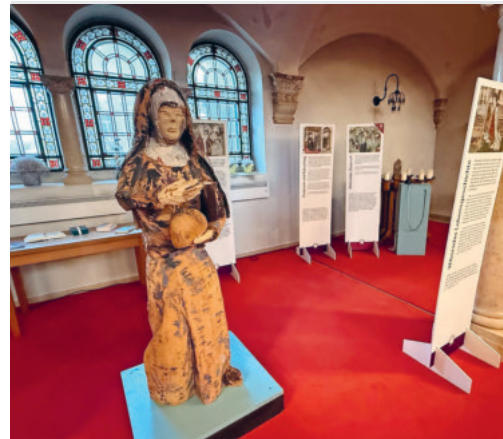
Wiborada in der Evang. Kirche Rorschach