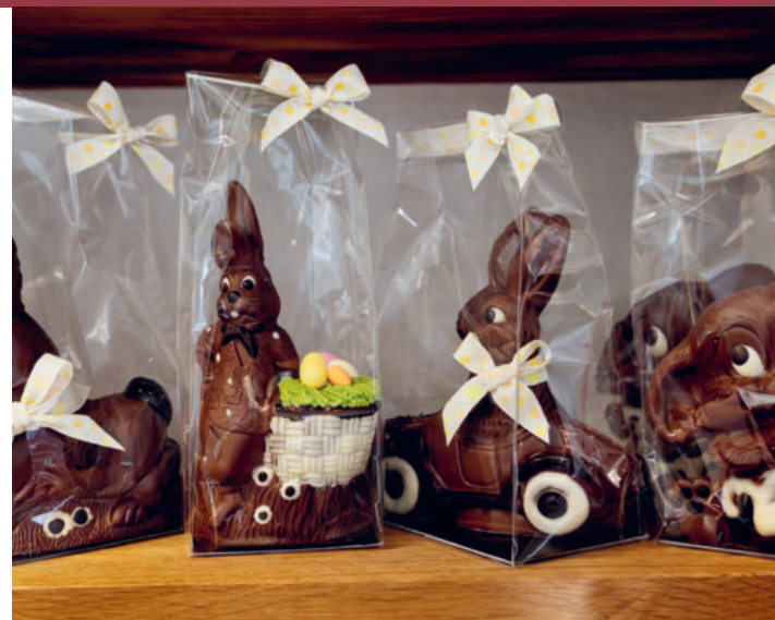
Osterhasen läuten die Ostern ein.