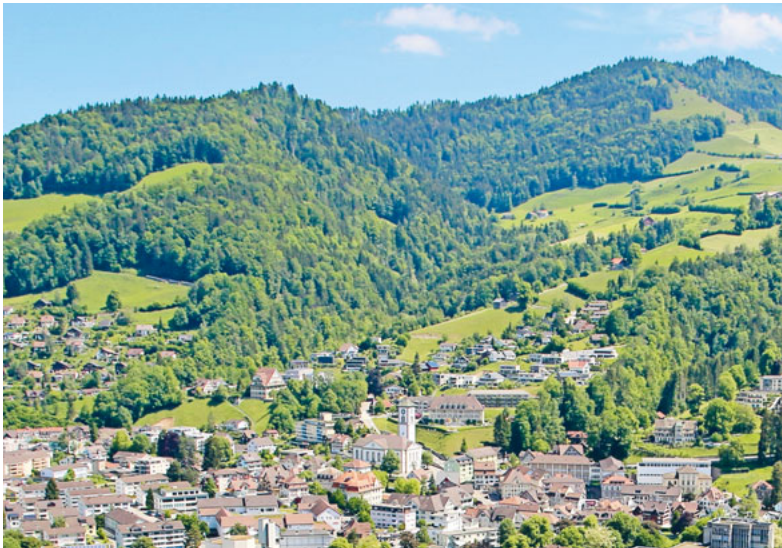
Die markante Kirche ist identitätsstiftend für das Wattwiler Ortsbild.