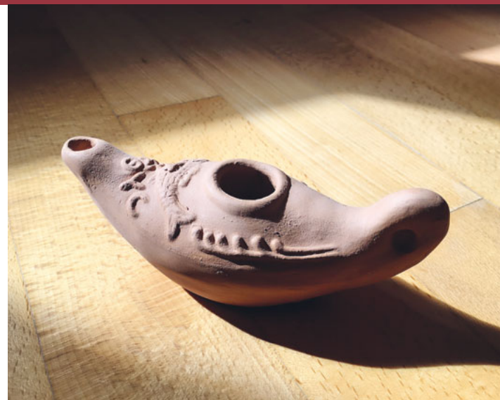
Diese Öllampen wurden für das Beleuchten der Katakomben in Rom benutzt.

Und was nimmst du von der Reise für deine Arbeit in die Kirchgemeinde mit? Das wird sich vor allem im Religionsunterricht zeigen. Aus eigenem Erleben unterrichtet es sich am anschaulichsten. Aber es gibt auch etwas ganz Konkretes: Beim Besuch in den römischen Katakomben habe ich eine tönernerne Öl-Lampe gekauft. Diese Gefässe, mit einfachem Docht, wurden einst für die Beleuchtung in den unterirdischen Gängen der Katakomben benutzt. Unser KidsCamp, das wir mit rund 30 Kindern in der ersten Herbstferienwoche durchführen, steht unter dem Motto «Feuer und Wasser». Als