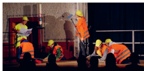
Szenenbilder aus der Vorführung.

Aber er hielt an Gottes Liebe fest, mit Blick auf all das Gute in seinem Leben und im Bewusstsein der Grösse Gottes.