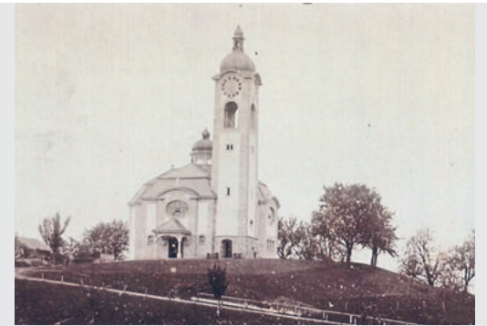
Kirche Haldenbüel ohne Glocken und Uhr