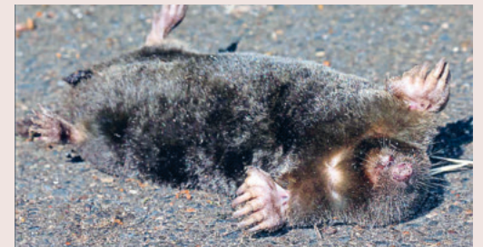
Ein würdiges Begräbnis für ein Tier hilft beim Trauern.

Vortrag mit Aussprache: «Wie begräbt man einen Maulwurf?» – Antworten auf grosse Kinderfragen über Tod und Leben Kinder und Erwachsene schauen auf Sterben, Tod, Trauer und Hoffnung auf sehr unterschiedliche Weise. Deshalb können Gross und Klein voneinander so viel lernen: was tröstet und was Mut macht, woher die Hoffnung kommt, die zuerst nicht zu sehen ist und doch