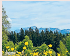
Aussicht vom Gottesdienstplatz im Scherrer in Richtung Säntis.

Was für eine Aussicht! Vom Gottesdienstplatz gleich neben dem Restaurant Churfürsten im Scherrer sieht man wunderbar den Säntis und den Speer vor sich. Die Bäuerinnenvereinigung Heiterswil ist Gastgeberin mit einer Festwirtschaft. Das Gofechörli Hemberg unter der Leitung von