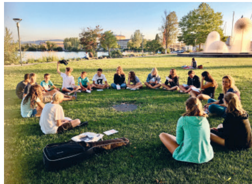
Das TeensCamp bietet Spiel, Spass und Gemeinschaft für Jugendliche an. Jetzt anmelden.