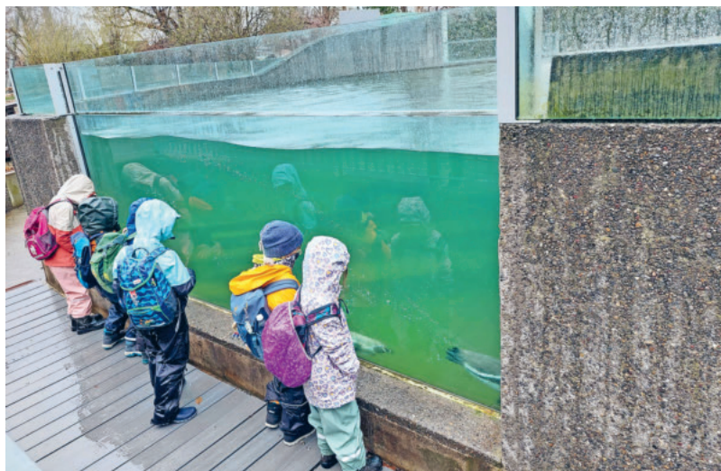
Am Lernort Kirche-Anlass der Erst- und ZweitklässlerInnen ging es in den Kinderzoo Rapperswil, wo auch die Schöpfung und Jona und der Wal durchgenommen wurde.

Die Briefe zur Anmeldung für den kommenden Konfirmationsjahrgang werden Ende Mai an all diejenigen Jugendlichen verschickt, welche