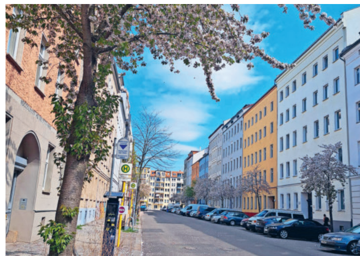
Unterwegs auf der Konfreise Berlin.