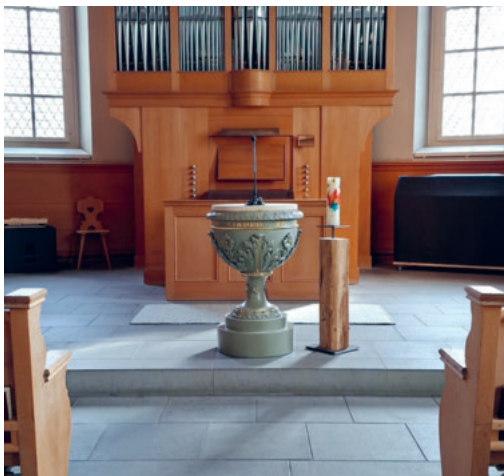
Der Taufstein aus dem Jahr 1888 ist frisch restauriert und steht wieder in der Kirche Wildhaus.